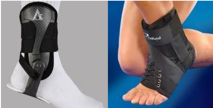
En bra gymnastik sko kan kompletteras med Fotledsskydd

Handskar skall värma, vara smidiga och ha ett bra grepp . Under den varma delen av sommaren passar baseballhandskar bra och när det är lite kallare rekommenderas isolerade långdåkningshandskar med bra grepp, även ridhandskar brukar fungera bra. I närheten av klubben ligger även uffeshoppshop.se som har det mesta du kan behöva under din fallskämskarriär. Vanligtvis håller Uffe extra öppet någon gång under kursen så du har möjlighet att titta/prova/fråga och köpa grejer direkt i butiken. Man behöver dock inte köpa nya grejar utan ta med det du har hemma till kursen och visa för kursledarna så hjälper dem er att se vad som passar bäst.